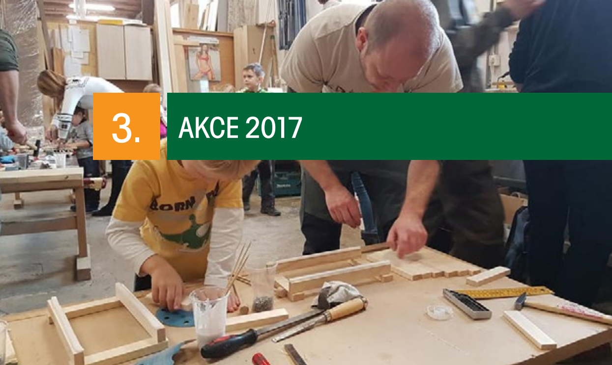
VELIKONOČNÍ A VÁNOČNÍ TRUHLÁŘSKÁ DÍLNA