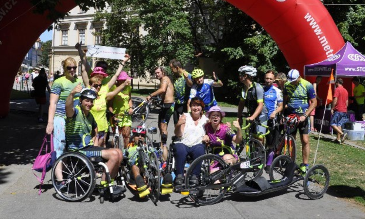
METROSTAV HANDY CYKLO MARATON