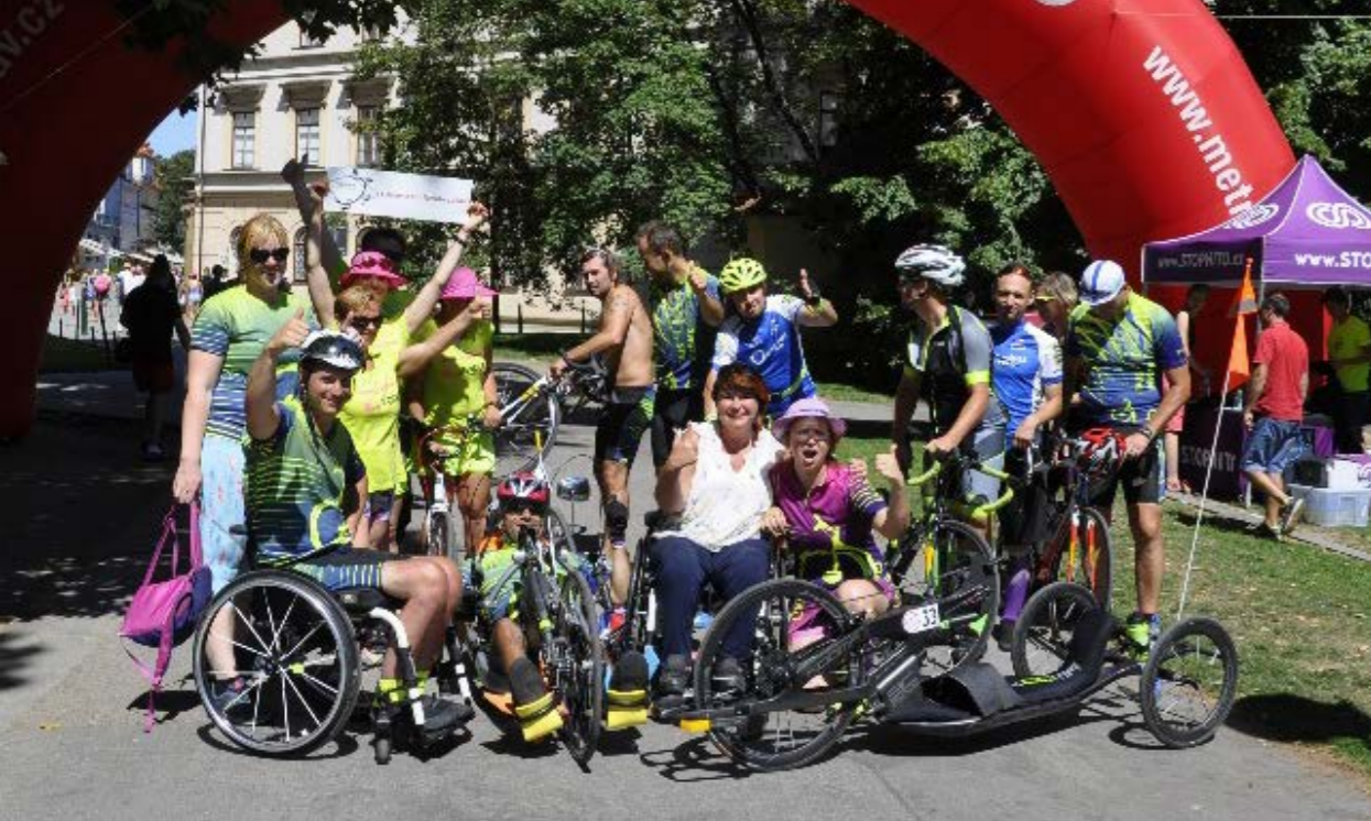
METROSTAV HANDY CYKLO MARATON